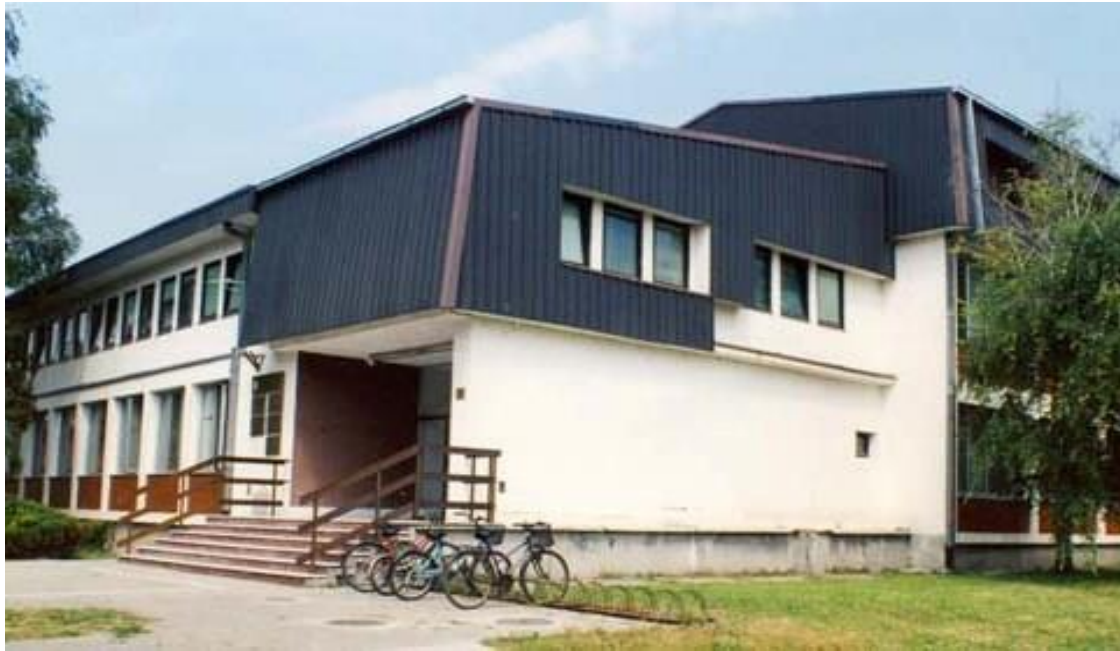
слика 1 - Зграда правосудних органа у Врбасу у којој се налази Основно јавно тужилаштво у Врбасу